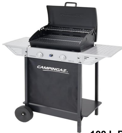
100 L PLUS