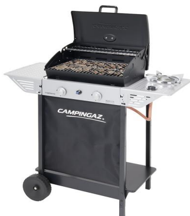
100 LS PLUS ROCKY