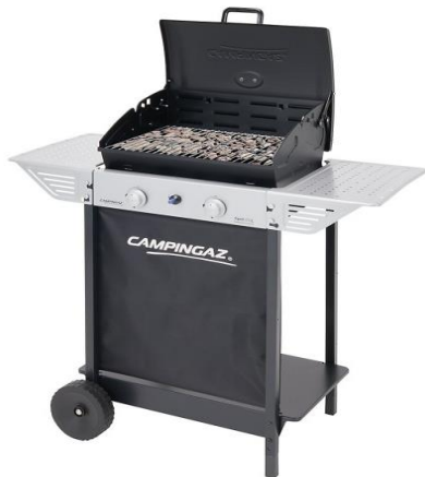
100 L ROCKY 100 L PLUS ROCKY