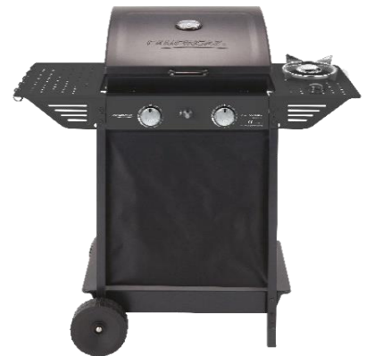
100 LS PLUS