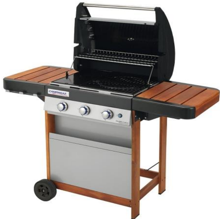
CLASS 3 WLX (ELECTRONIC) CLASS 3 WLX FR (PIEZO)