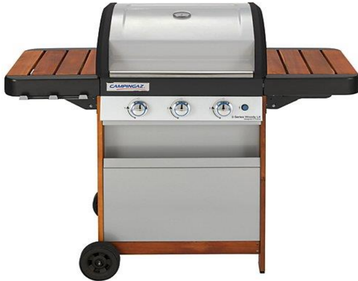
3 SERIES WOODY LX